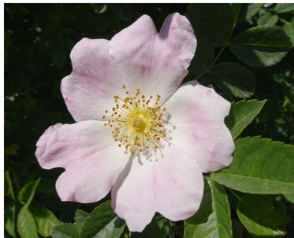
Rosa canina 21.5.2020