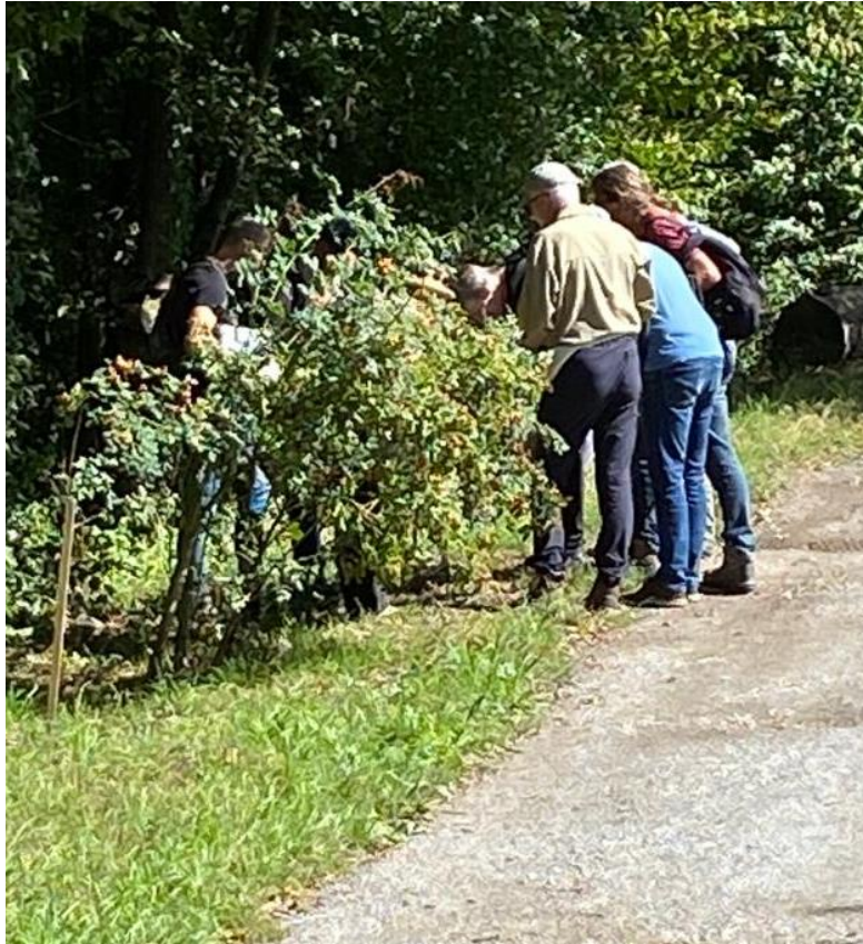
BAS-Wildrosen-Exkursion 2.9.2023 in Stuttgart

Sonnenberger Wildrosenrain auf 7220-422 N 48.44.48,4; E 009.08.52,3 hellmutwagner@gmx.de