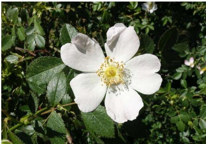
Rosa agrestis 21.5.2020