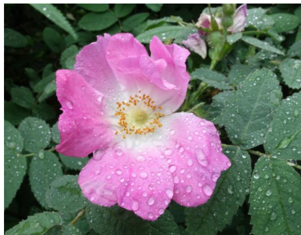
Rosa villosa 23.5.2020