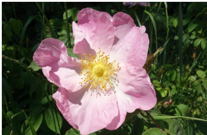
Rosa gallica 21.5.2020